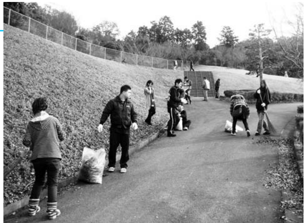
年末を前にした公民館等の大掃除

61の団体とスポーツ少年団からあわせて500人もの参加により施設はピッカピカになりました。