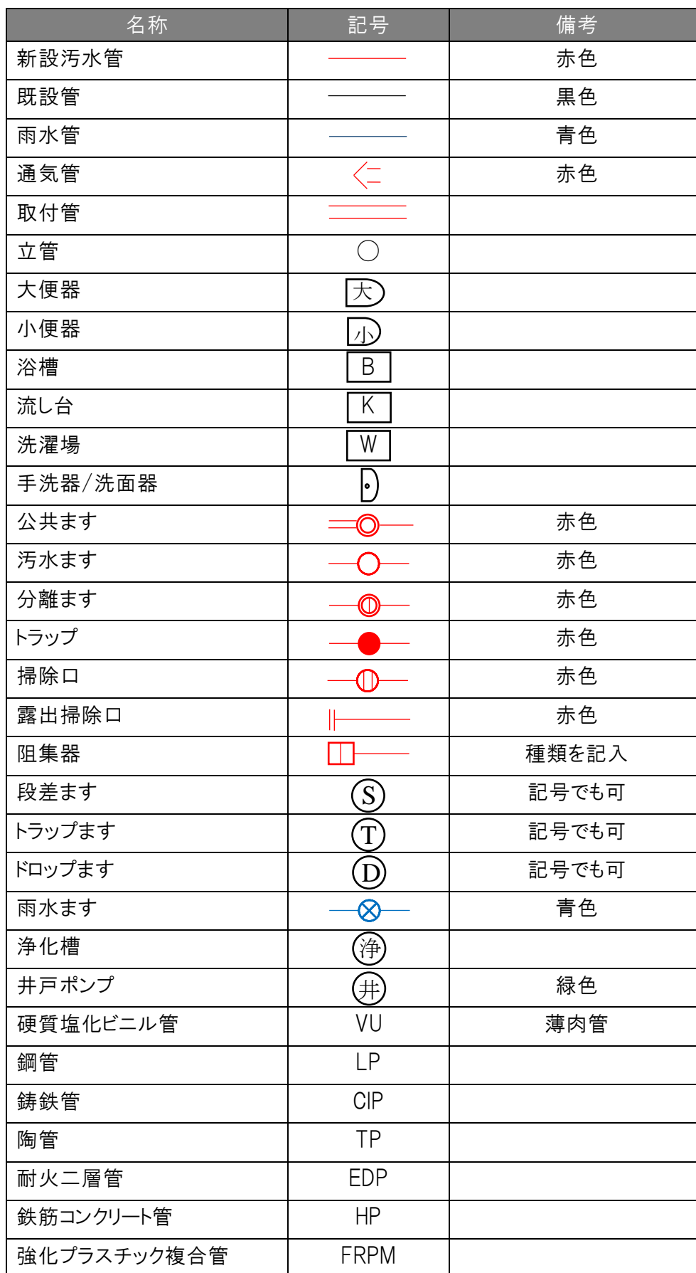
表2-1 排水設平面シンボル例