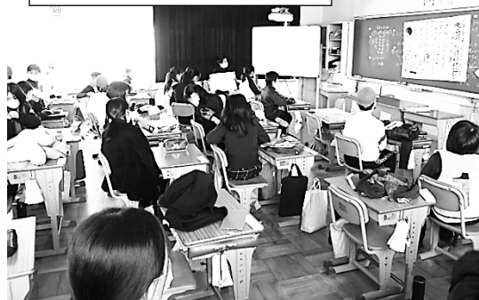
送られる6年生の教室