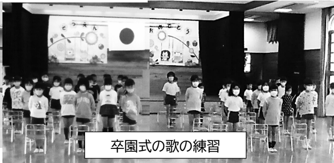
卒園式の歌の練習