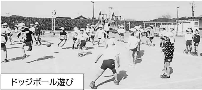
ドッジボール遊び

こども園では、3月28日の卒園に向けて、園での思い出作りをしたり、小学生になる準備をしたりしています。ドッジボールの後に聞いてみると「逃げまくる作戦で、ずっと逃げた!」「1人当てた!」など、それぞれが「自分はどうしよう!」とめあてや見通しをもって活動していたのが分かりました。みんなでやる活動の中でも、ひとりひとりが生き生きしていたことに納得しました。