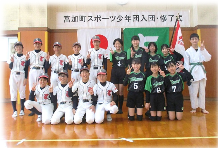
富加町スポーツ少年団入団・修了式

富加町スポーツ少年団では、練習の見学や入団の受付を随時行っています。興味のある方、入団を希望される方はお気軽に各部育成会長または、富加町 B&G 海洋センター、（富加町スポーツ少年団事務局）までお問い合わせください。