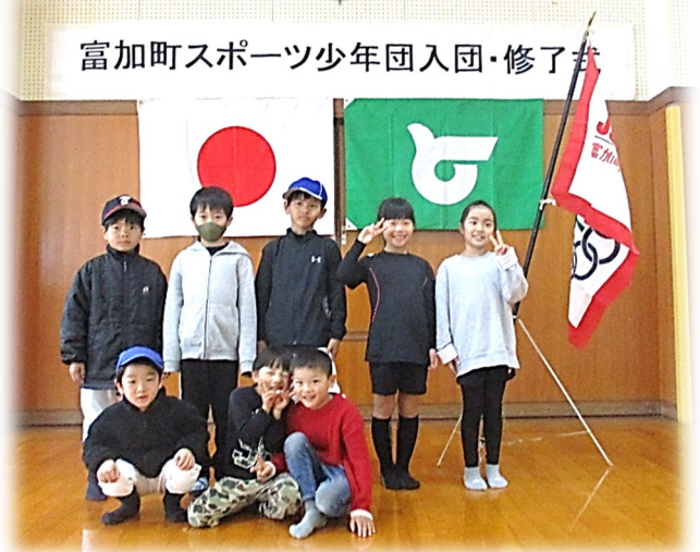
富加町スポーツ少年団入団・修了式