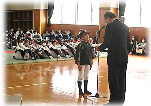
運動適正テストⅡ 1級合格者表彰