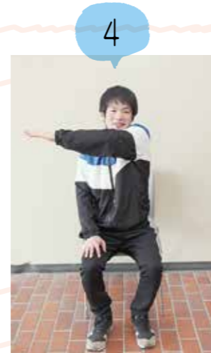
片腕を胸の前で交差し