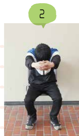
大きく息を吐きながら手を前に伸ばし