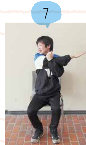
反対の腕も行いますそれぞれ2回ずつやってみましょう