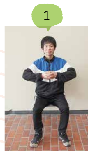
両手を胸の前でくみませ