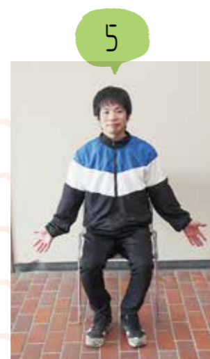
両手をお腹から足の横に広げます