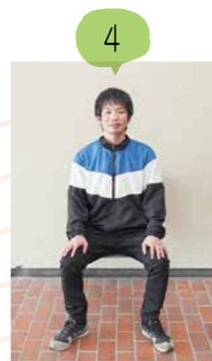
背筋を伸ばして座り