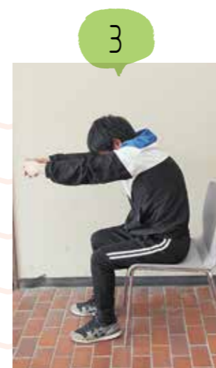
背中を後ろに下げながら丸めます