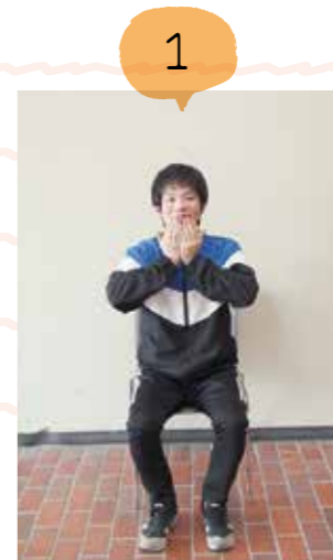
両手を胸の高さにもっていきます