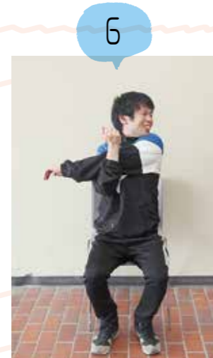
視線は伸ばしている肩の方に向けます