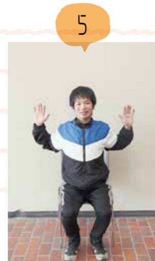
肩甲骨を寄せますゆっくりと4回行いましょう