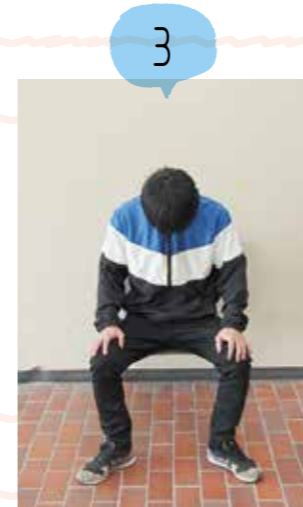
おへそを覗くように下を向いてから、ゆっくり顔を正面に戻します