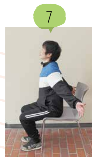
ゆっくりと2回やってみましょう