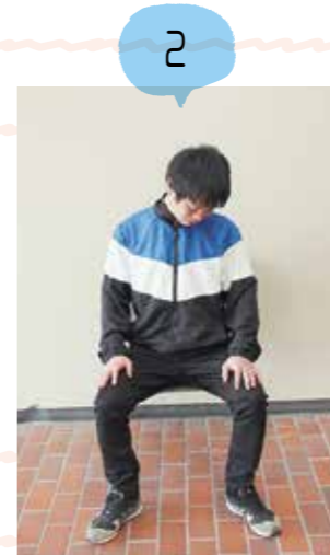
視線を斜め下に向け、首の後ろを伸ばします