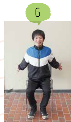
肩を後ろに引いて胸を正面に開きます