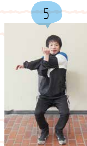
反対の手で肘をつかみ、体に引き寄せます