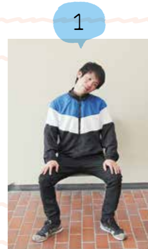
耳と肩が近づくように頭を横に傾けます