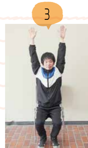
両手を開いてバンザイします