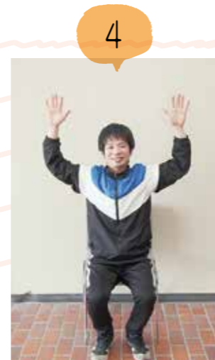
肘を曲げながら両手を下ろし