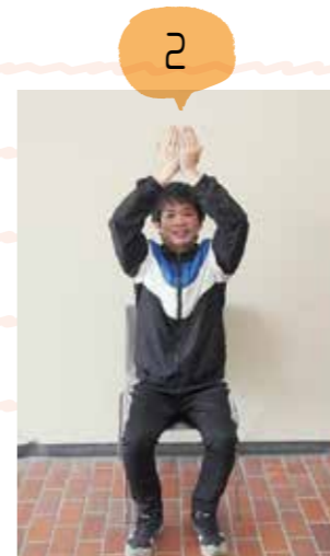
手のひらが顔の前を通るように上げていき