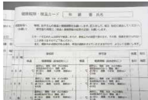
毎日の検温・健康観察カード

昨年度末から春休みにかけて、子どもたちが安心・安全に学校生活を送ることができるように、富加町教育委員会とも協力して、学校では準備をしてきました。この危機を回避するためには、地域の皆様のご支援、ご協力が欠かせません。一人一人の命を守るためにも、ご協力よろしくお願いいたします。