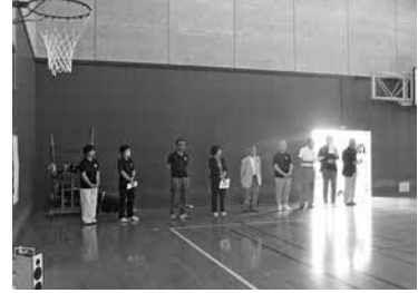
町6人制ソフトバレーボール大会