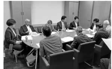
今井雅人 衆議院議員