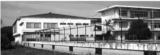
富加小学校体育館

小学校体育館への空調整備は、児童の熱中症対策、学校開放による地域スポーツやコミュニティ振興の拠点であること、災害発生時の避難所として必要性を十分認識しており、先進地事例などを参考に導入を模索してきました。こうした状況を経て、小学校体育館への空調整備を令和8年度事業で実施したいと考えています。今回の9月議会では、その設計業務費用を補正予算に計上させていただいたところです。