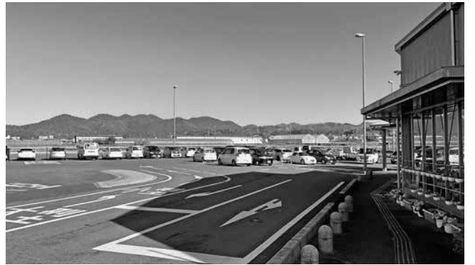
道の駅の駐車場のようす(羽生地内)

また、道の駅は地域交流の場としての基幹施設であり、活性化に向けた取組に積極的に携わり、その機運を高めていきたいと考えています。