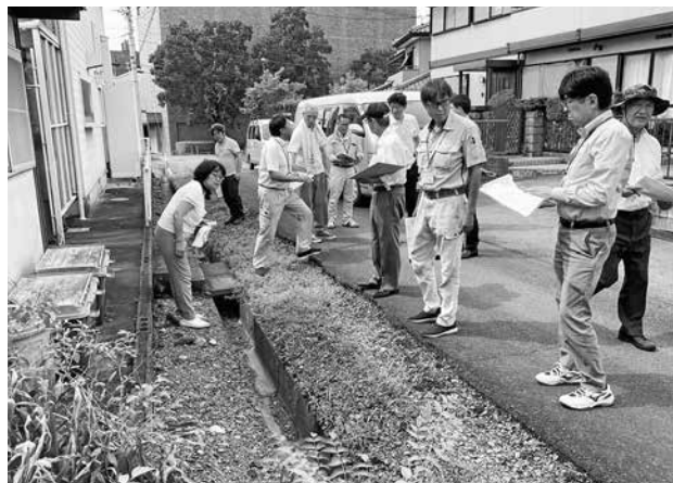
町単工事の要望箇所を確認する委員

慎重な審議の結果、その他の案件も含め、所管する案件は原案のとおり可決すべきものと決定しました。