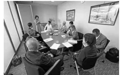
渡辺猛之 参議院議員(秘書)