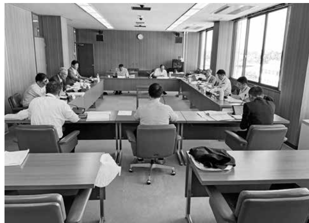
文教厚生常任委員会のようす

慎重な審議の結果、その他の案件も含め、所管する案件は原案のとおり可決すべきものと決定しました。