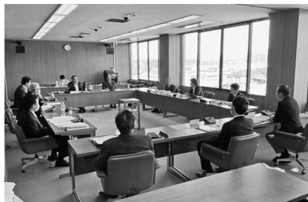
文教厚生常任委員会のようす

慎重な審議の結果、その他の案件も含め、所管する案件は原案のとおり可決すべきものと決定しました。