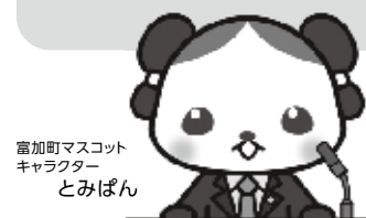
富加町マスコットキャラクター とみぼん