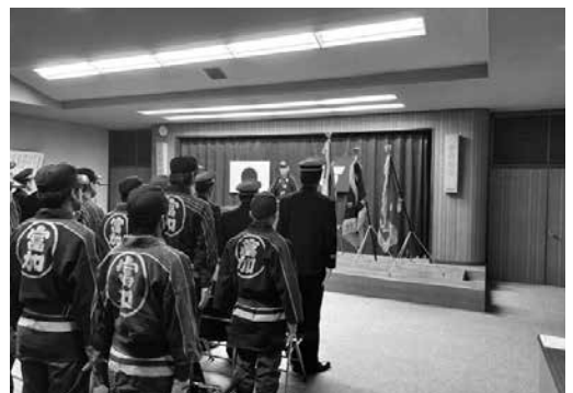
町消防団年末夜警激励会