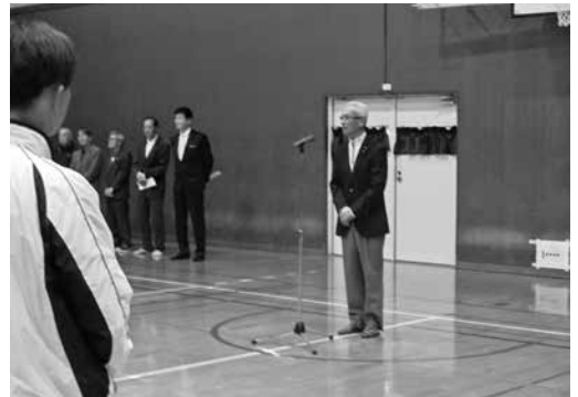
町やわらかバレーボール大会