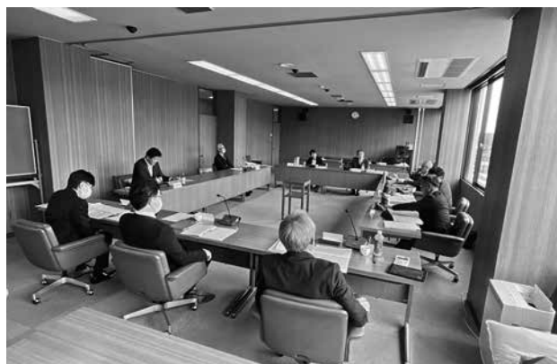
総務産業建設常任委員会のようす

慎重な審議の結果、その他の案件も含め、所管する案件は原案のとおり可決すべきものと決定しました。