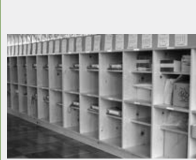
大きなランドセルもしっかり入るロッカー

そのランドセルも時代とともに変わってきました。色がカラフルになり豪華な刺繍が施してある物もあります。そして昔と比べて最も変わったのが大きさです。現在の教科書、ノートはA4サイズが主流です。それに伴ってランドセルも昔より一回り大きくなってきているのです。そうすると困るのがランドセルを片付けておくロッカーです。そこで夏休みを利用して、ロッカーのサイズを大きくする工事を行っています。2学期始業式には、木目が美しい木の香りのする素敵なロッカーが子どもたちを迎えます。