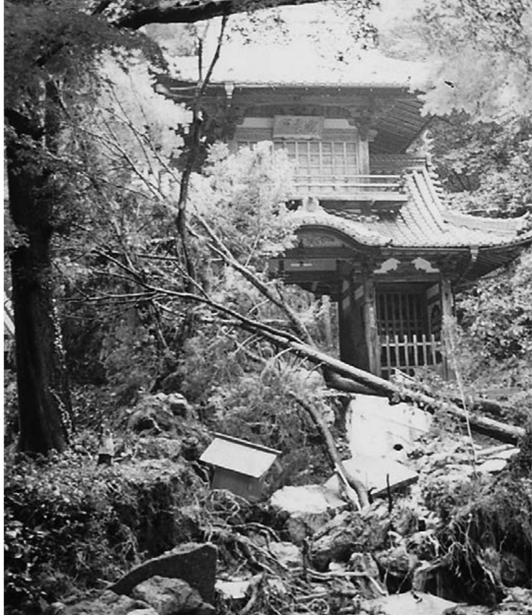
平成4年8月11日 集中豪雨により被害を受けた清水寺

集中豪雨や台風は、土石流、がけ崩れ、洪水などを引き起こし、大きな被害をもたらすことがあります。こうした災害に遭わないために、雨量や土砂災害の前ぶれに注意し、避難方法や避難場所を確認するなど「自分の安全は自分で守る」という気持ちで、日ごろから準備しておくことが大切です。