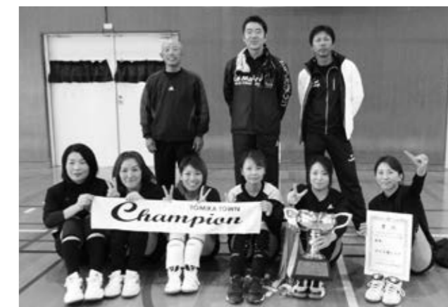
優勝した大山西チーム