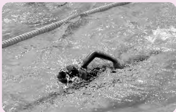
夏休み最後の水泳検定の様子

暑い、暑い夏休み。予想はしていましたが、これだけ暑いとは！しかし、子供たちは、元気いっぱいです。プールで一生懸命泳いで、泳ぎを上達させている子。今年から始まったサマースクールで苦手な学習を克服しようとしている子。学年相談日や理科、社会科相談日で夏休みの研究に熱心な子等々、それぞれ子供たちが夏休みにチャレンジしています。