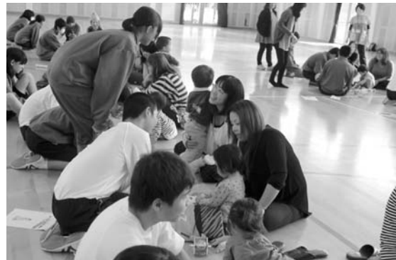
お母さん方との交流