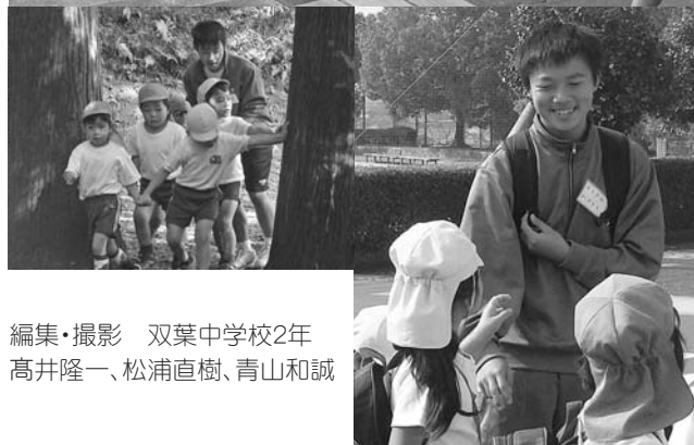
編集・撮影 双葉中学校2年 高井隆一、松浦直樹、青山和誠