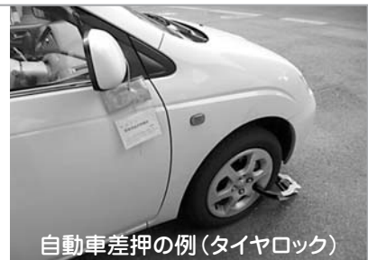
自動車差押の例(タイヤロック)

病気や失業、事業の廃止や経営不振など、やむを得ない理由で一時的に税金などを納めることが困難な方は、住民課税務グループへ必ず相談をしてください。