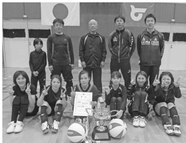
▲優勝した大山西チーム