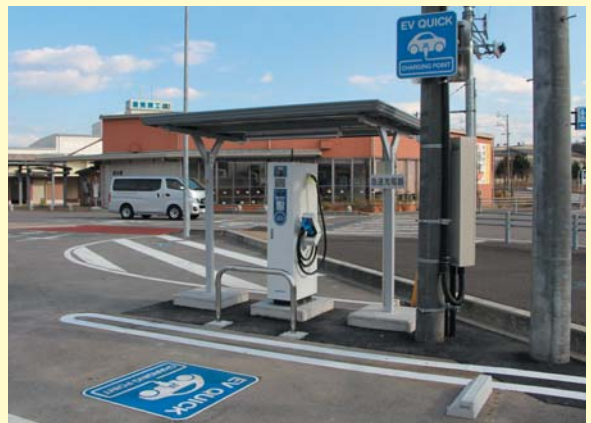
道の駅「半布里の郷とみか」に設置された急速充電器

町では、経済産業省と国土交通省の政策に連動した道の駅への充電インフラ導入プロジェクト（E-OASISプロジェクト）により、道の駅「半布里の郷とみか」に電気自動車用急速充電器を設置し、2月15日（月）から充電サービス（有料）を開始しました。