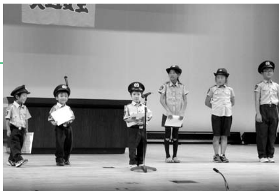
子ども達による 交通安全宣言

また、交通安全大会では、子どもたちによる交通安全宣言が行われ、「道路では遊ばない」「知らない人にはついて行かない」「出かける時は行き先を言って出かける」などの宣言をしたほか、白川町演劇サークルの皆さまによる、交通安全啓発劇「ハンドルキーパー」が公演され、白熱した演技で飲酒運転の恐ろしさを訴えました。