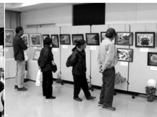
力作揃いの作品展示