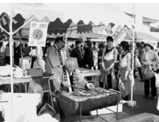
志摩からは海産物や てこねずし