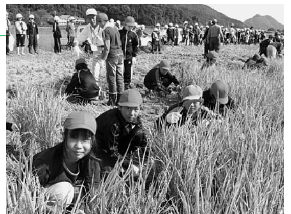
昔ながらの貴重な体験ができました。