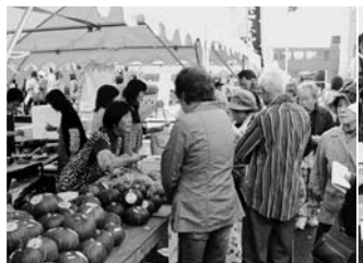
秋の農産物もいっぱい