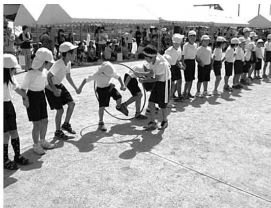
児童会種目で、仲間の絆!

9月22日(土)に運動会を開催しました。文字通りの秋晴れの空の下、全校児童280名全員が、元気いっぱい参加しました。スローガンは「ワクニコ・協力・元気よく!」でした。「ワクニコ」とは、「わくわくにここにこ」心弾ませるという意味です。写真は、児童会種目「絆でぐれ!レインボーリング!」という競技です。1年生から6年生までが一つの輪になって手をつなぎ、声を掛け合いました。赤も白も仲間の絆が一段と深まりました。結果は、赤団540点、白団634点で白団の総合優勝でした。一方、応援合戦は赤団が優勝しました。多くの来賓の皆様、保護者や地域の皆様にご声援をいただき、子どもたちにとって、とても充実した秋の一日となりました。