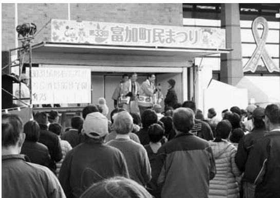
愛農会の大ビンゴ大会