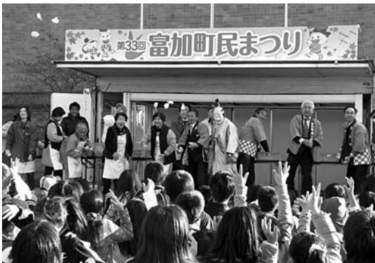
景品付きもち投げ大会

富加町民まつりが11月17日、18日の2日間にわたって開催されました。初日はあいにくの雨により一部のイベントが中止となりましたが、二日目は天候も回復し、町内外から多くの来場者で賑わいました。実りの秋、芸術の秋 いっぱいの2日間となりました。