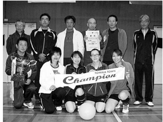
優勝された大平賀Aチーム