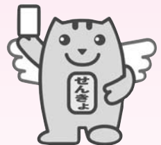
みんなの一票を大切に

投票所入場券は解散日から投票日までの期間が短いため、12月6日以降に有権者の皆様へ発送する予定です。期日前投票は12月5日(水)から行われますが、投票所入場券がなくても、投票所で本人確認をした上で期日前投票をすることができます。