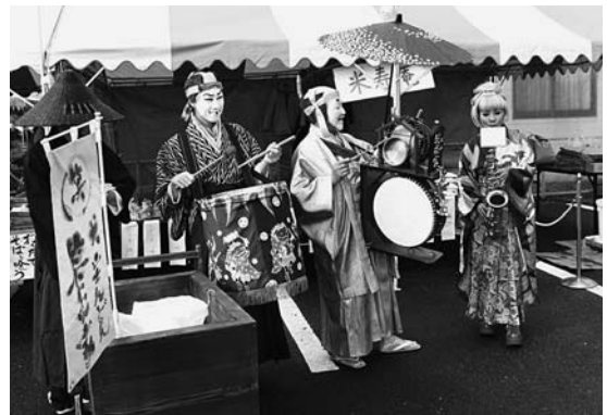
チンドン屋が盛り上げました