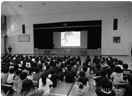
人権のビデオを真剣に観る児童

岐阜県では、子どもたちの人権感覚を高め、行動力を育成するために、毎年「ひびきあいの日」という取組を設けています。富加小学校では、12月5日（水）に全校集会を開き、ビデオを観て人権学習をしました。この日観たビデオの内容は、「一人ひとりの名前には、両親の愛情と願いがいっぱい込められている。だから、呼び捨てやあだ名で呼んで、相手を傷つけないようにしましょう。」というものでした。さらに担当の先生から、「自分のことと同じように相手のことも大切にできる人間になろう」という話を聞きました。子どもたちの中には、家に帰って早速自分の名前について尋ねたという子が何人もいました。このほか、学校では、「あったか言葉」を進んで使う取組や「よいこと見つけ」の取組など、子どもたちのよりよい仲間づくりに努めています。