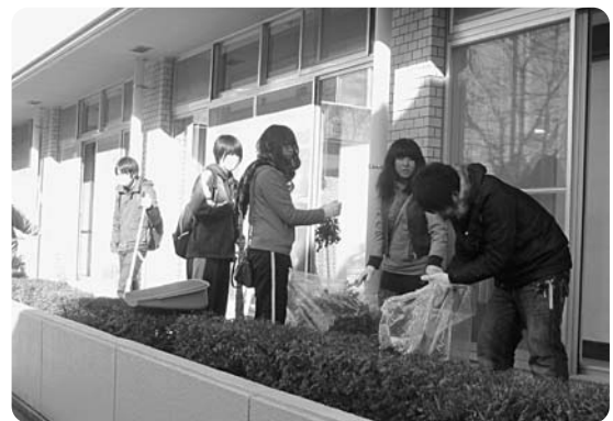
公民館等の大掃除

75の団体とスポーツ少年団からあわせて約400人のご協力により、きれいで気持ちよく使える施設になりました。