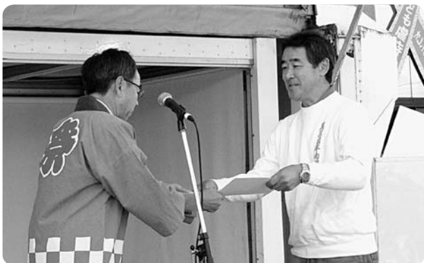
町民まつりにて表彰状の伝達が行われました

今は、会員約110人と大きくなった「半布里」を引っ張り「富加のまちから元気を発信！」を合い言葉に活動されています。