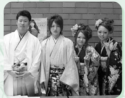
実行委員会4人の皆さん