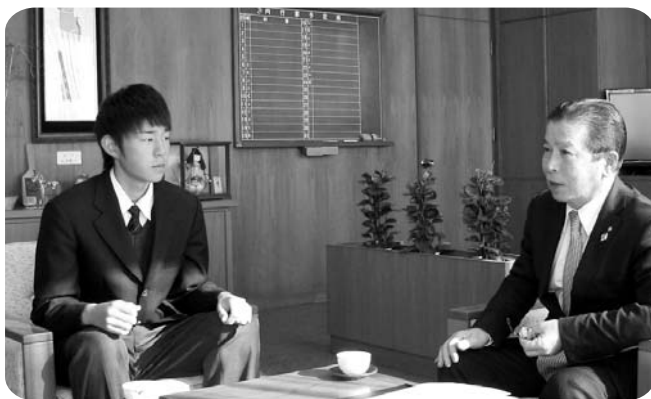
サッカーへの思い語る織部さん