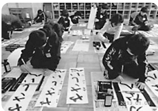
「今年はこんな目標でがんばる！」

1月7日、身が引き締まる寒さの中、第3学期が始まりました。翌8日には、全校一斉に書き初め会を行いました。放送で、『春の海』の美しい曲が流れる中、1、2年生は硬筆で、3～6年生は毛筆で、自分の今年の目標を力強く書きました。どの子どもとても真剣な表情で取り組み、学校全体の空気がぴんと張りつめた素晴らしい時間となりました。低学年は「大きな声であいさつをする」「大縄跳びをがんばる」「給食の好き嫌いをなくす」など、可愛らしいめあてを、中学年は「思いやり」「いっぱい読書」「健康第一」、高学年は「強い意志」「親切な心」「日々前進」などのめあてを書きました。中には、「初志貫徹」や「勇猛果敢」などの難しい言葉に挑戦する子もいました。日本のお正月らしい伝統行事ですね。作品は、1月末まで各教室や廊下に展示されます。