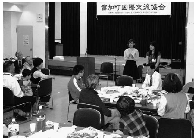
ベトナムから見た日本