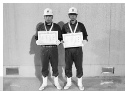
個人表彰 「ポンプ車の部」