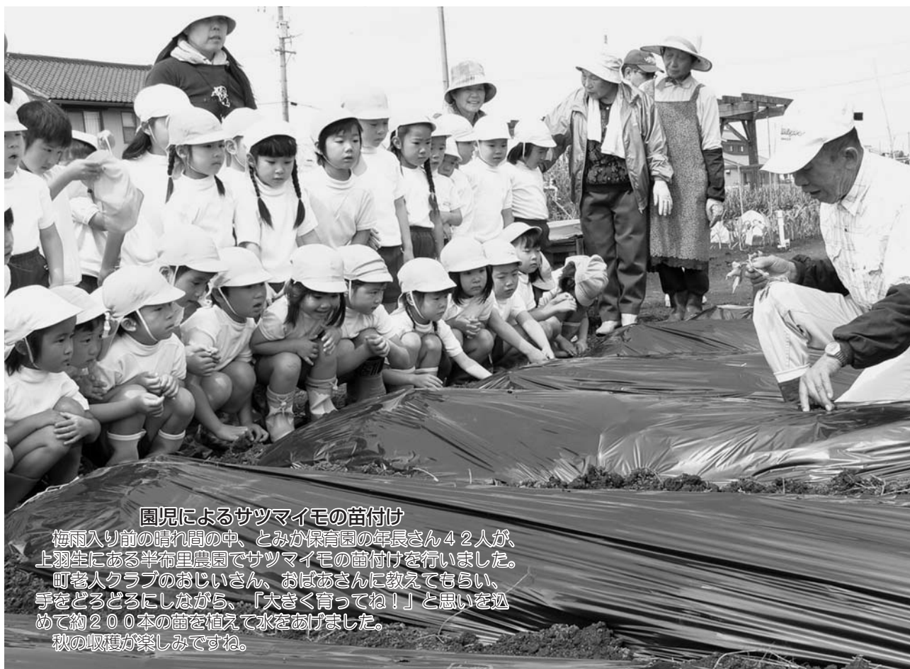
園児によるサツマイモの苗付け

梅雨入り前の晴れ間の中、とみか保育園の年長さん42人が、上羽生にある半布里農園でサツマイモの苗付けを行いました。町老人クラブのおじいさん、おばあさんに教えてもらい、手をどろどろにしながら、「大きく育ててね!」と思いを込めて約200本の苗を植えて水をあげました。秋の収穫が楽しみです。