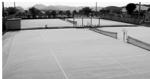
半布ヶ丘公園テニスコートの改修工事が完了し人工芝が新しくなりました。皆さんご利用ください。