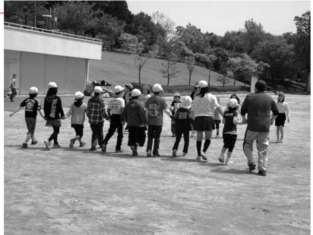
「なかよくグループ遊び」

5月2日（月）に児童会行事「なかよしレインボーク」を行いました。新1年生を仲間に迎え、6年生までの縦割り班で、半布ヶ丘公園まで仲よく歩いて校外活動に出かけました。到着すると早速どのグループも6年生のリーダーを中心に、ボールゲームや遊具遊びなどで夢中になって遊びました。ところがしばらくすると、「お腹すいたよー！」と、お弁当の時間が待ちきれない子も。青空の下、みんなで食べたお弁当はとてもおいしかったです。学校へ戻って、校長先生から活動がなぜ楽しくできたか、次の3つの点を褒めてもらいました。「みんながわがままをしなかった」「優しさや思いやりがあった」「リーダーの指示をよく聞いた」富加小のなかよしの絆が深まった一日でした。