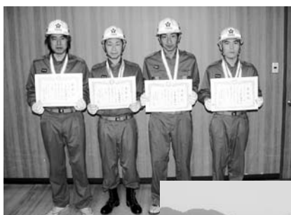
個人表彰 「小型ポンプの部」