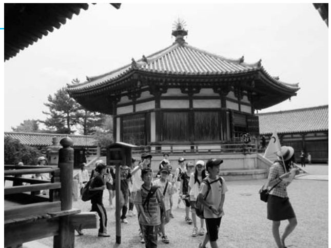
「法隆寺夢殿の前にて」

6月2日、3日に、6年が修学旅行に出かけました。学校を出発するときは、天候が心配されましたが、京都に着いた頃には雨も上がりました。二条城では、「うぐいす張り」の廊下で感心したり、英語を使って外国の方とのコミュニケーションにチャレンジしたりしました。その後、子どもたちはグループ毎にタクシーに乗り込み、自分たちで計画したコースに分かれて、金閣寺や清水寺の見学をしました。2日目は、奈良の法隆寺や奈良公園、東大寺などを訪れました。帰りのバスの中でも、元気よく歌を歌ったりゲームをしたり、最後までスローガン通りの「スマイルいっぱい、思い出いっぱい」の修学旅行になりました。