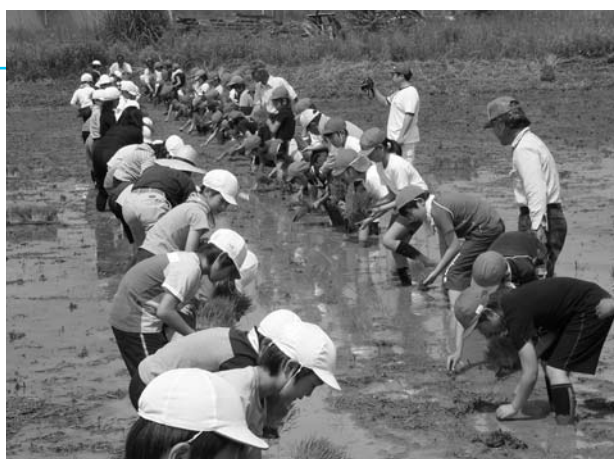
富加の子はどろんこも平気な様子でした。