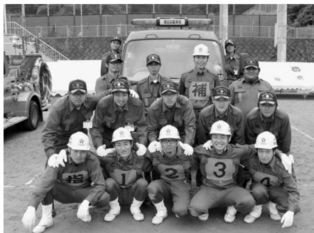
滝田自動車班の皆さん

滝田自動車班は、町の代表という重圧の中、競技順1番目に出場しました。惜しくも上位入賞はなりませんでした。厳しい訓練を積み重ねてきただけある、堂々たる操法を披露しました。