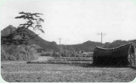
川浦川脇にあった名木「轟の松」

町内のみなさんから寄贈していただいた懐かしい町の写真を展示します。富加町の風景や、生活の様子を写した古い写真を見ながら「昔はこんなだったな～」と懐かしんでみるのはどうでしょうか。他にも江戸時代の絵図や、昭和初期の航空写真などの資料も展示します。是非ご来館ください。