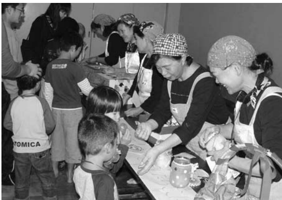
においを嗅いだり手探りしたり