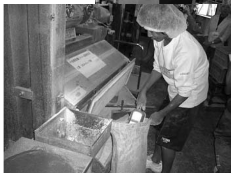
桜井食品での作業「腰が疲れます。」