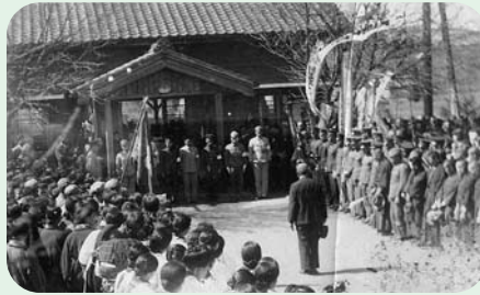
加茂野駅(現富加駅)出征