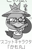
マスコットキャラクター「かも丸」

この度、「みのかも定住自立圏ホームページ」が開設されました。マスコットキャラクターの「かも丸」が、わかりやすくお知らせしています。ご覧ください。 アドレス https://wikii.jp/kamomaru/doku.php?id=start