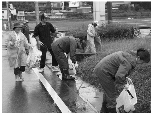
カッパを着てのグリーン作戦