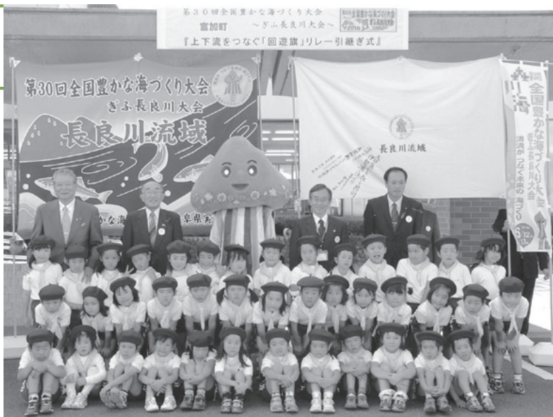
引継ぎ式後の記念撮影

この回遊旗は、10月28日に無事、関市に引き継ぎされました。来春には、最下流の自治体の三重県桑名市から再び遡上し、出発地点である郡上市に帰って行きます。