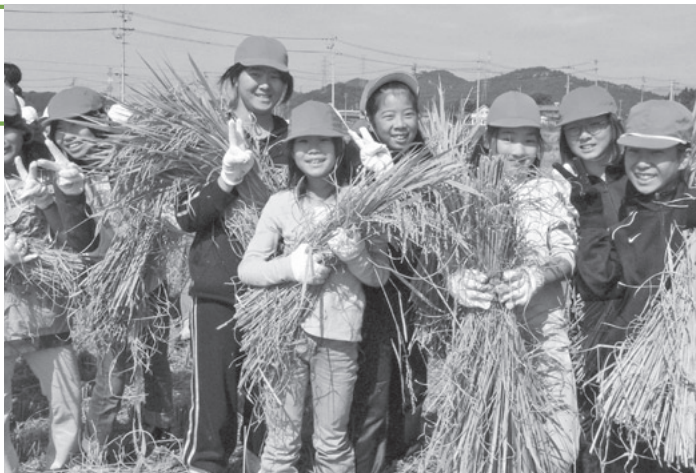
収穫の喜びを体感した児童たち

収穫した餅米は、今月に開催される「富加町民まつり」にて、児童ら自ら杵でつき、餅にする予定です。