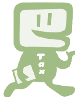
e-Taxイメージキャラクター「イータ君」

また、ご自宅やオフィスから申告や納税、各種申請・届出などの手続きができる「国税電子申告・納税システム(e-Tax)」の周知及び利用促進にも重点的に取り組みます。