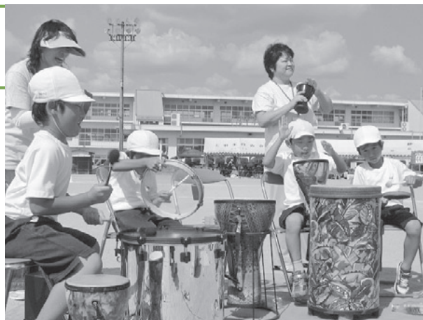
リズムに乗り、楽しむ子ども達

今年の運動会は、昼休み時間中にNPO法人ぎふ音楽療法協会の皆さんに来ていただいて、楽器演奏の鑑賞と太鼓などの多くの打楽器の体験会をしていただきました。ストレス社会といわれる現代、一般的に健康な人でも音楽療法は必要といわれます。歌を歌うことや楽器の演奏をすることは、脳のすべての分野を使うため心身にとってもよいことが分かってきています。ぎふ音楽療法協会では、高齢者向け、成人向け、児童向けのプログラムを用意されており、児童向けには音や音楽を使って成長の手助けをするよう考えられています。この児童向けのプログラムを運動会向けに特化して、どの子どもが楽しめるようにカラフルな太鼓など大量の楽器を体験させてくれました。音響設備の不備で聞き取りにくい部分もありましたが、集まってくる子が次第に増えていき、どんどんと慣れ親しみ、リズムを覚えていく子ども達の力に感心しました。