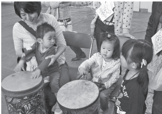
音楽療法に用いられる楽器にふれる子どもたち