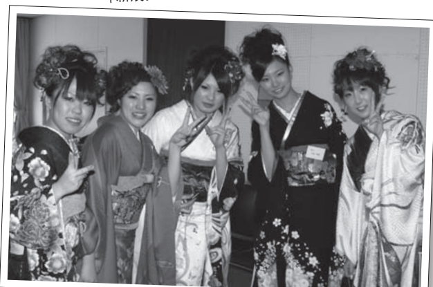
パーティー会場の様子