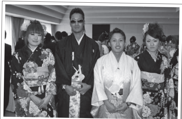
式典後のパーティーなど様々な企画に携わられた実行委員の皆さん