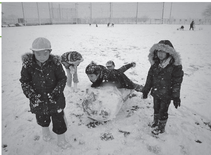
もっと大きな雪だるまになれ！

1月13日～15日は、ここ富加でも例年にない大雪で富加小のグラウンドにもたくさんの雪が積もりました。大人は、うんざりですが子どもは大はしゃぎ。朝、雪の積もっているのを見ると、もういてもたってもいられず、まずは雪合戦、雪だるまづくりが始まりました。これをしないと、落ち着いて授業ができませんでした。雪だるまは、雪国ほどの積雪量はないので砂にまみれてきたないですが、おかまいなしです。グラウンドのあちこちに何個もできて、しばらくの間溶けずに残っていました。雪合戦は、ここぞとばかりに先生を集中してねらったり、何個も作りためておいてから当てに行くなど、様々な姿が見られました。この3日間で、登校中に滑って転んだり、雪を投げながら歩くので列がばらばらになったりと、トラブルが多く発生しました。また、雪玉を相手が嫌になるまで手加減無く当ててしまうなど、指導しなければならない場面に出くわすなど、考えさせられた3日間でした。