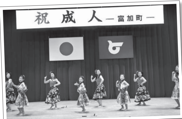
「メレ・モエ・フラサークル」による演舞